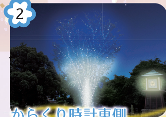
2 からくり時計東側