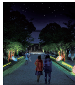
大樹寺「和の光 Art Night」※画像はイメージです。

東岡崎駅(10時15分発)→岡崎公園(10時25分発)→三菱自動車(株)(PHEV_World・オートギャラリー)→おぎ乃(昼食)→岡崎公園(岡崎城・三河武士のやかた家康館・家康公生誕祭)→大樹寺(宝物殿・和の光 Art Night)→岡崎公園着(18:00着予定)→東岡崎駅(18時10分着予定)