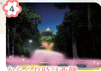
4 からくり時計西側