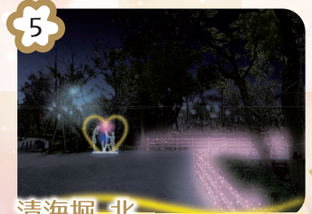
5 清海堀 北