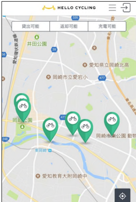
「ステーション」検索画面