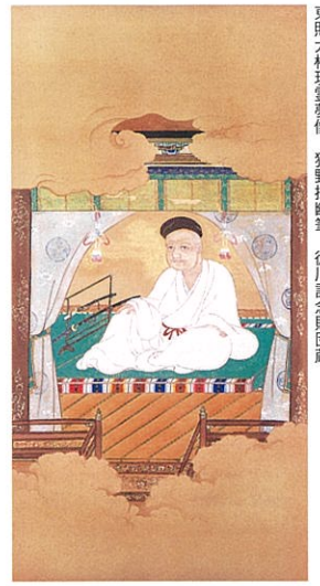
東照大権現霊夢像 狩野探幽筆 徳川記念財団蔵