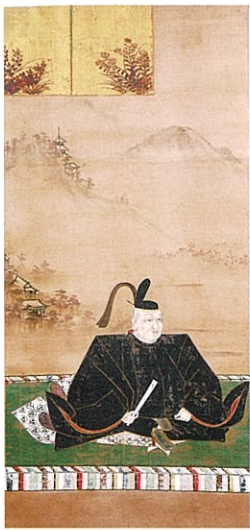
〔静岡市指定文化財〕徳川家康像 静岡・宝台院蔵〔前期〕