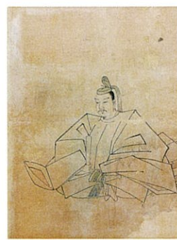
徳川秀忠像 徳川記念財団蔵