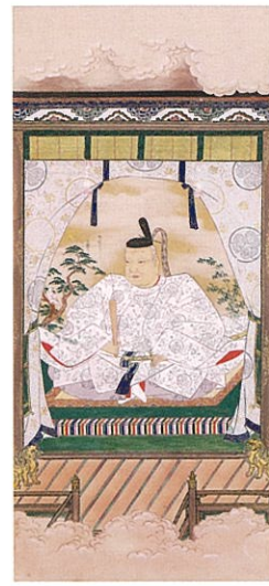
東照宮御影 四月十七日拜礼 伝狩野探幽筆 徳川記念財団蔵