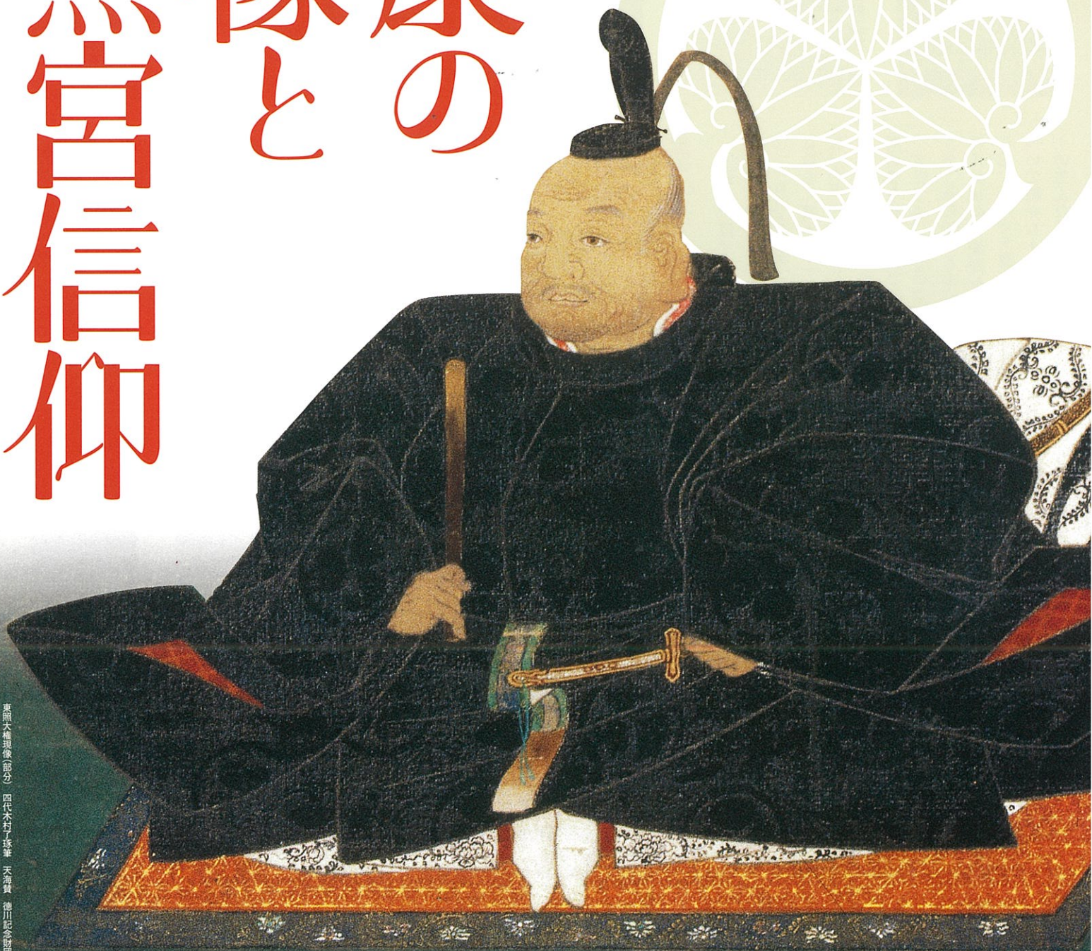
東照大権現像(部分) 四代木村了琢筆 天海賛 徳川記念財団蔵