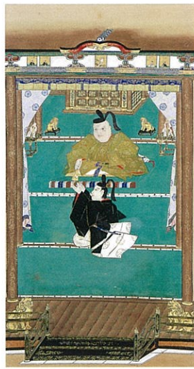
東照大権現霊夢像 徳川家康・家光対面像