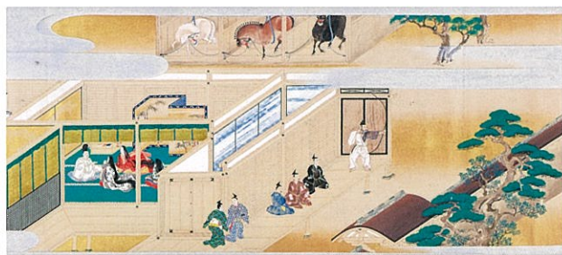
東照宮縁起絵巻 巻第一 住吉如慶筆 〔前期〕

当館の位置する岡崎市は、徳川家康の生誕の地です。岡崎城に生まれた家康は、江戸幕府を開いて天下泰平の礎を築き、その生涯を閉じた後には、神格化されて「東照大権現」として祀られ、各地に東照宮が建立されました。家康の肖像は数多く残されていますが、これは各地の寺社や将軍家、大名家などで崇拜され、祭祀に用いられたことによります。その姿は生前の家康を描いた画像をはじめ、祭祀等のために作成された東照大権現像、三代将軍家光が夢に現れた家康の姿を描かせた霊夢像など多岐にわたります。