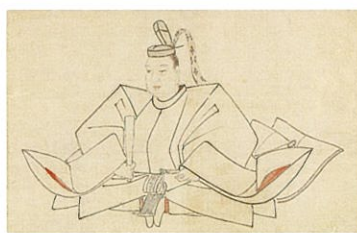
徳川家光像 京都・知恩院蔵〔後期〕