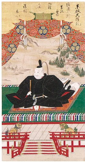
東照大権現像 西尾・長園寺蔵