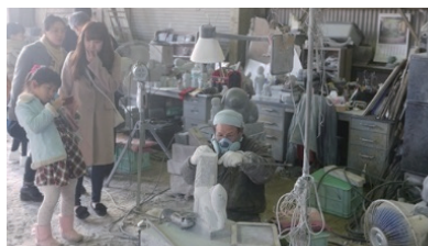
②フィールドワーク