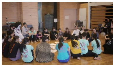
①オリエンテーション